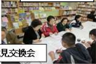
終了後の意見交換会