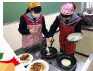
クリスマスパーティーとケーキ作り