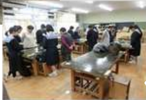
お茶のお点前と百人一首