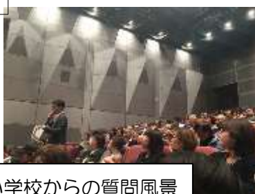
小学校からの質問風景