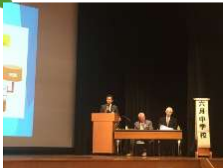
塚原校長先生発表