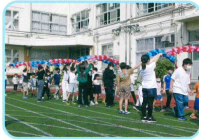
共に学び合う学校 ◆1年生を迎える会