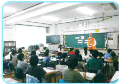
生命を大切にする学校 ◆バリアフリーについて学ぶ授業

●月～金曜日：登録した児童が参加できます（1年生は6月開始予定、学年によって参加する曜日が異なる場合もある。）