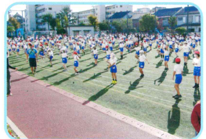
体力向上を図る学校 ◆短縄集会