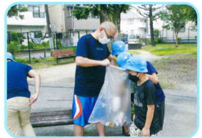
思いやりの心の育つ学校 ◆西一ピカピカデー