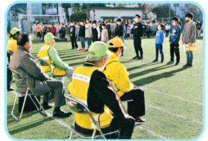
地域・保護者とともに考え 歩む開かれた学校 ◆感謝集会（交通安全ホラントレーン）