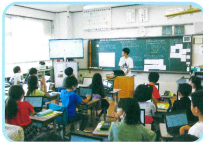
学力向上を図る学校 ◆問題解決型の授業