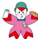
おたんじょうびデザート