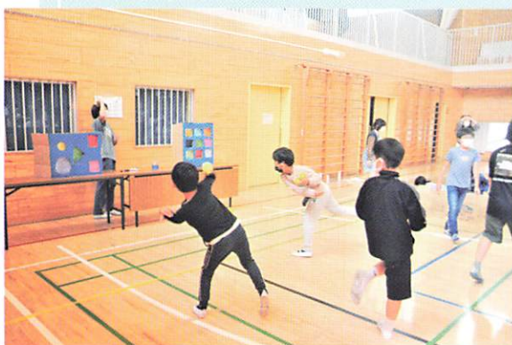
中川小お楽しみウィーク