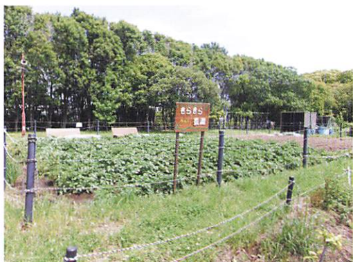
きらきら農園・農業体験