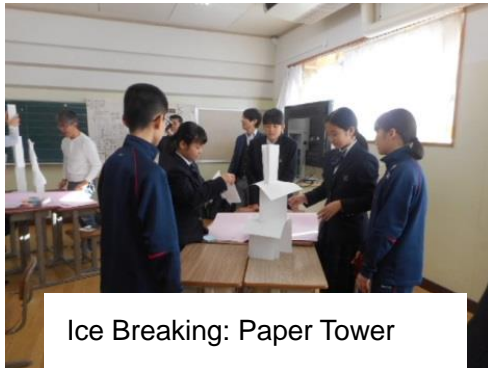
Ice Breaking: Paper Tower

Are you good at *verbal communication? We use language when we communicate each other or when we think. Today we focused on the verbal communication. We tried “Brain Storming” and learned “Graphic Organizer”. These skills are helpful when you think about many kinds of things such as school subjects or matters around you. The students tried the mission “Make a PR video of Kohoku Sakura JHS”. They discussed in the group, shared the idea, and then made wonderful presentation. *verbal=言葉の