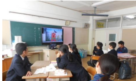
What's “Brain Storming”?