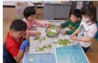
5月の一コマ 「グリーンピースのさやむき」