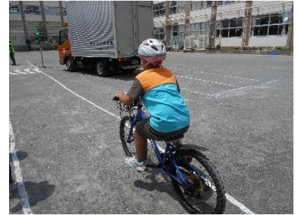
自転車教室の様子

先日の自転車教室では、竹の塚警察署やトラック協会の方々のご指導の下、交通安全や正しい自転車の乗り方について学ぶことができました。ヘルメットをきちんとかぶり、交通安全に十分に気を付けて乗るよう、ご家庭でもお声掛けをお願いいたします。当日は、自転車の貸し出しや、お手伝いにご協力いただきましてありがとうございました。