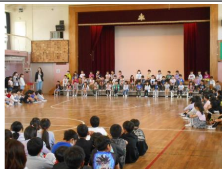
☆1年生を迎える会の様子☆