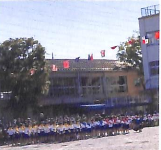
一年生 水井下キなごき