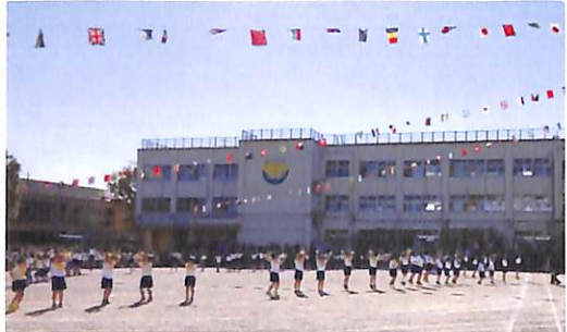
二年生 ふりふり のびのび 元気~