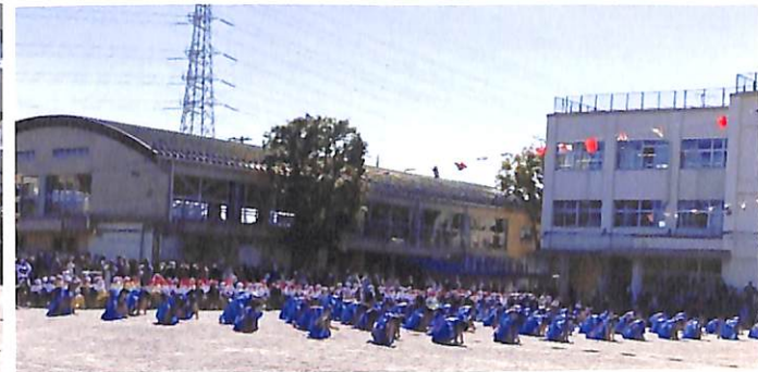
五年生 朝一番のプログラム 感動をありがとう