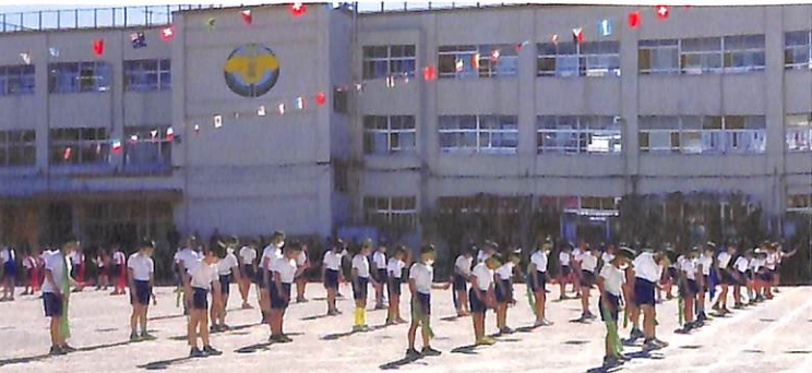
四年生 練習の成果大