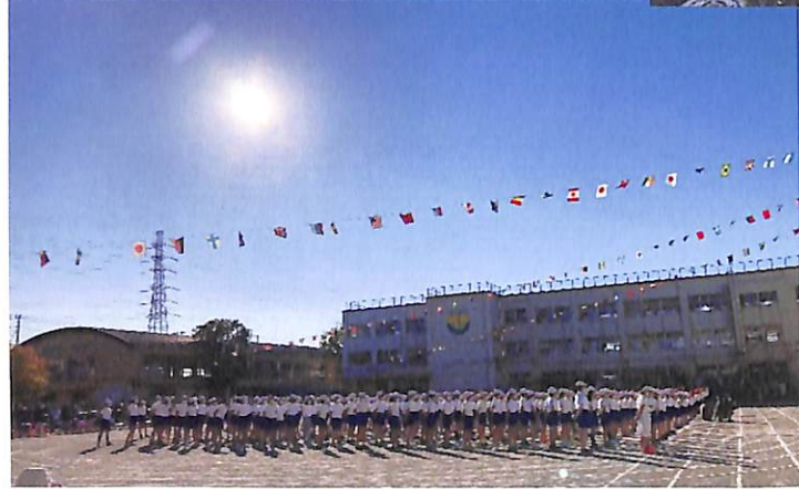
開会式から心は一つ! おひさまハロハロ~