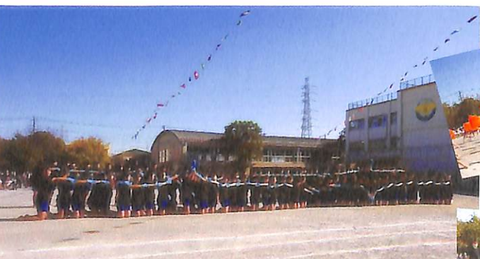
六年生 流石 心は一つ! 暁~AKATSUKI~