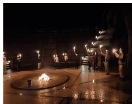
炎を囲んで・・・