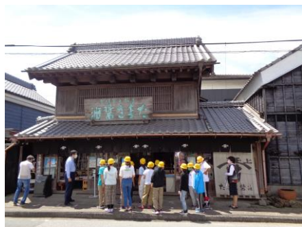
お醤油づくり見学