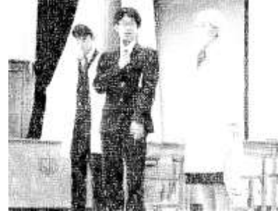
4/8 対面式 委員会紹介