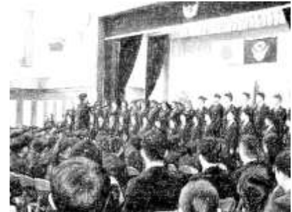
校歌紹介（2・3年生校歌隊）