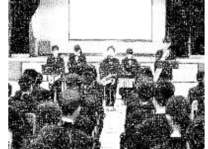
4/8 部活動紹介 吹奏楽部