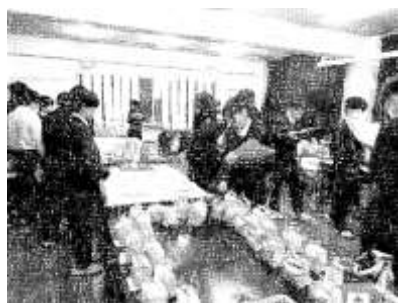
1/16・1/17 作品展 1年魚沼産コシヒカリ