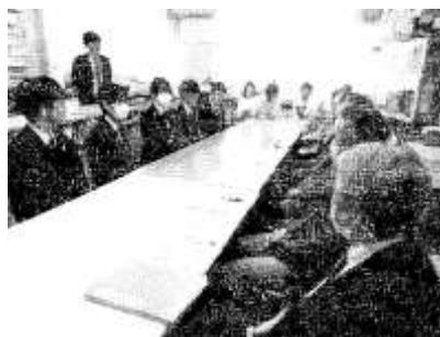
1/17 開かれた学校づくり協議会 生徒会との交流会