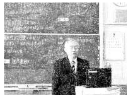
2/3 オンライン全校集会 （インフルエンザ流行のため）