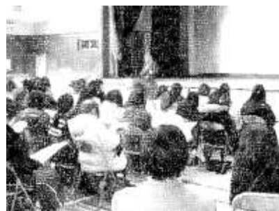
1/30 新入生保護者説明会