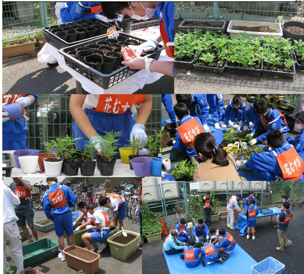
種蒔、花苗の植替え、プランターの土壌改良