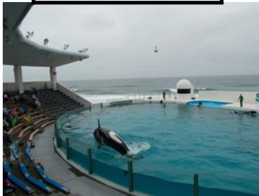
鴨川シーワールド