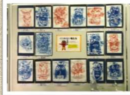
連合学習発表会（いなほ）