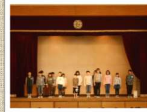
児童会役員引継ぎの会