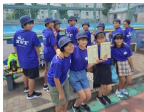
男子200mリレー 第2位入賞 女子200mリレー 第3位入賞

6年生の有志12名が、8月26日(土)竹の塚小学校で実施された第52回足立区小学校水泳大会に参加し、12名全員が見事に自己記録を大幅に更新。12名の中には、泳ぎが得意でないにもかかわらず、夏休み中の特別練習に欠かさず参加し、最後まで泳ぎ切った児童もいました。「努力は決して裏切らない」ということをみんなでご実感していました。