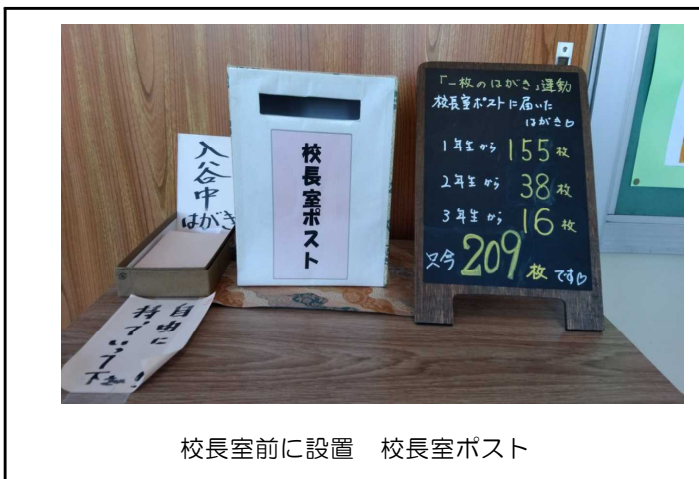
校長室前に設置 校長室ポスト

国語科を中心に全教員で「語彙力の育成」に取り組んでいます。今年から実施している「一枚のはがき」運動も校長室ポストには209（2/21現在）枚のはがきが届いています。