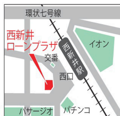
足立区西新井栄町 2-3-15 WATANABEビル1階