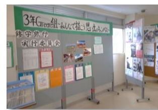
2階のコーナー（生徒が運営）

6月末、2階に素敵なコーナーが誕生しました。修学旅行まであと2ヶ月ですが、間に夏休みが入ることから、実行委員会の生徒がかなり早くから準備をしてくれていました。コーナーを歩いているだけで修学旅行への関心や意欲が高まります。