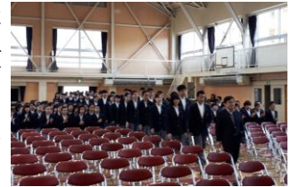
16日 予行練習の様子

いよいよ明日は卒業式です。3年生が中学校生活を本気に生きてきたことを讃え、笑顔で送りたいと考えています。保護者や地域の皆様には、これからも素直な心を持ち、大きな声でありがとうと言える人間に育つようご協力をお願いします。