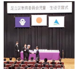
児童・生徒褒賞式

生徒たちは、それぞれ様々な素敵な力をもっていることを改めて感じるとともに、第九中学校の校長であることを誇りに思える瞬間をもらいました。