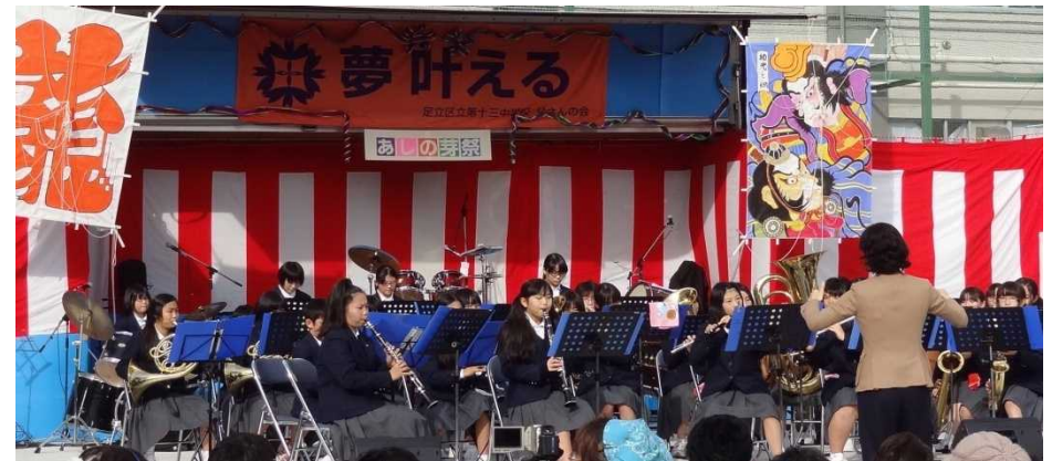
♪♪♪ 本校吹奏楽部 ♪♪♪

後 援：開かれた学校づくり協議会・第十三中学校 同窓会・PTA・生徒会・あしの芽会